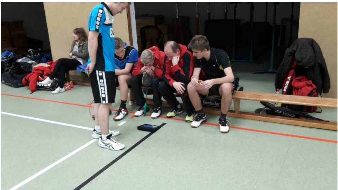
Handball-EM- Halbfinale- ZDF-Live- Stream...